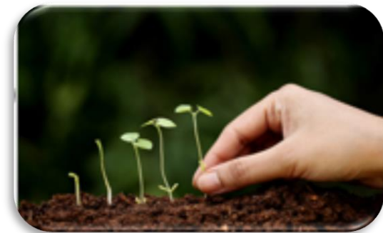
Kasvu ja kehittyminen