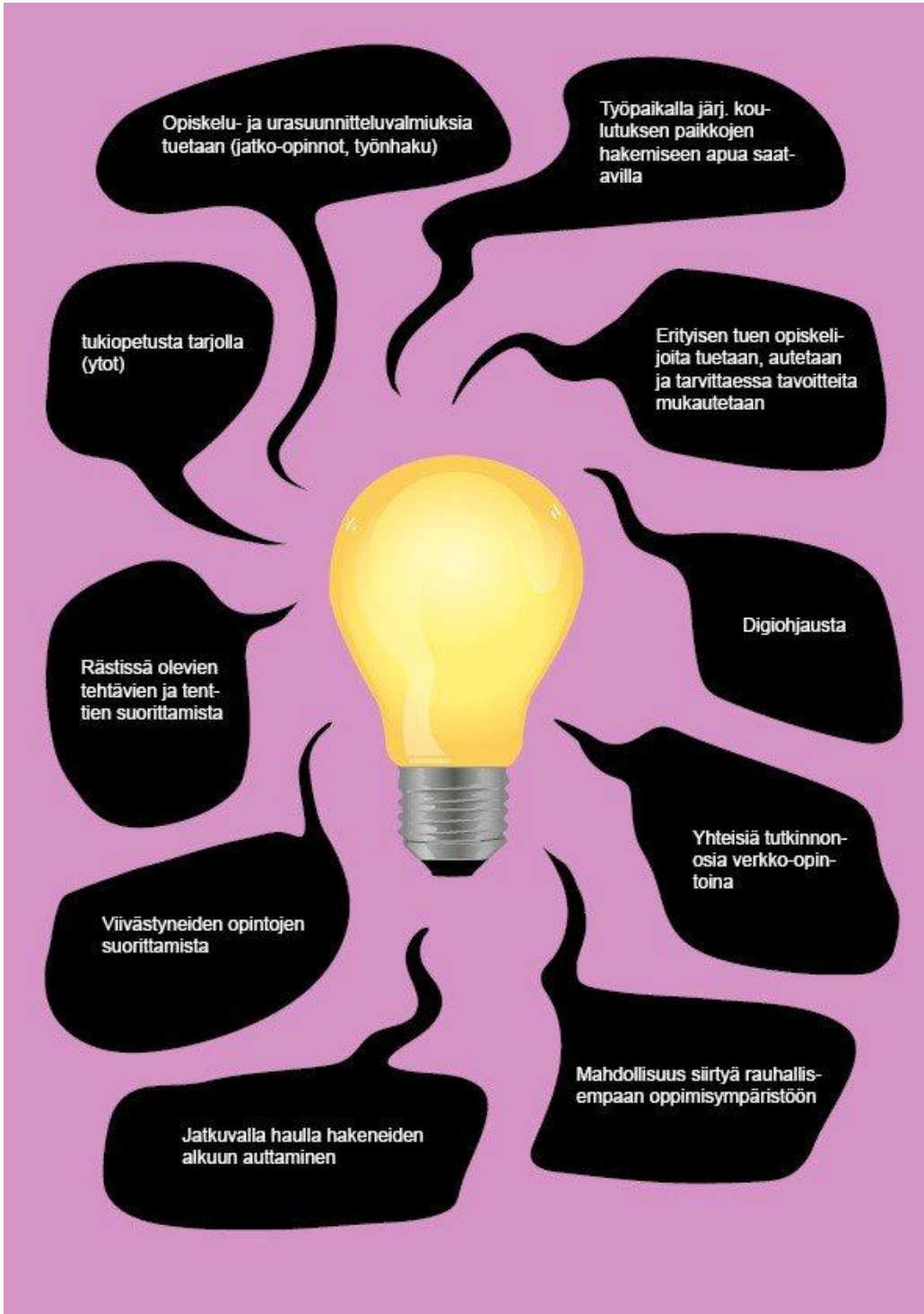
Kuvio 2. Opintojen etenemisen tukitoimet Saskyssä.

Opintojen etenemisen tueksi on oppilaitoksissa tarjolla erilaisia palveluja.